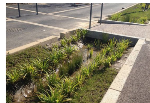
Exemple de mesure compensatoire – Nœud d'infiltration en milieu urbain